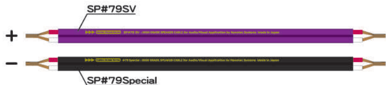
ハイブリッド使用の例

●PC-OCC 導体を使用した SP#79 SR は導体の生産終了に伴い、生産完了いたしました。