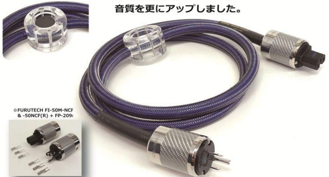
© FURUTECH FI-50M-NCF & -50NCF(R) + FP-209I