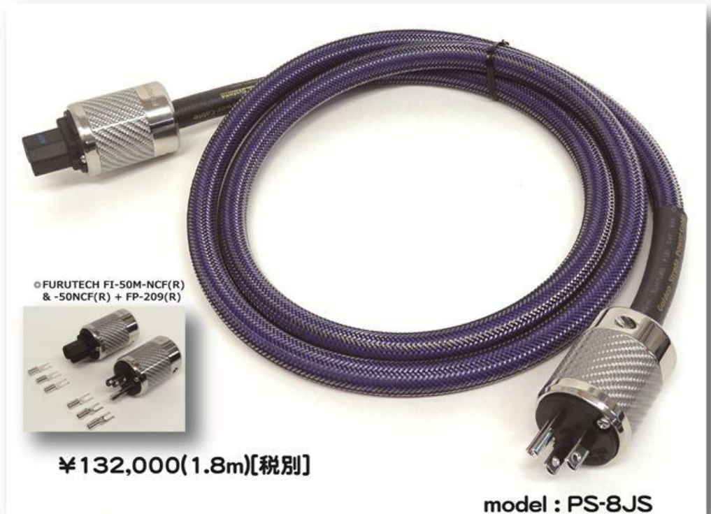
◎FURUTECH FI-50M-NCF(R) & -50NCF(R) + FP-209(R)

今話題の、PC-Triple C 導体とコロイド液とのコラボレーションで 極めてスムーズで力強い電流を、オーディオ・ビジュアル機器に供給しました [POWER STRADA 8J] が一段と進化!!!